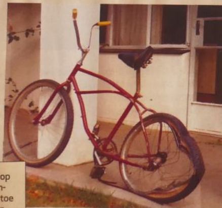
Die fiets waarop Barend Liebenberg gery het toe die trok hom in 1992 getref het.

Deur COLIN HENDRICKS