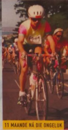
11 MAANDE NÁ DIE ONGELUK